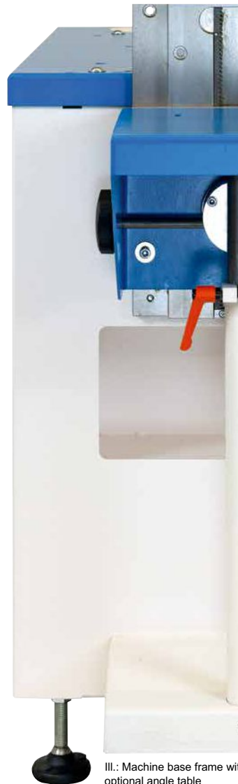
Ill.: Machine base frame with optional angle table