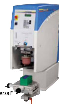
"Hermetic 9-12 universal"