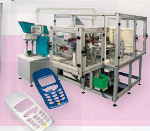
Praktický plastový kryt, navržený pro perfektní přístupnost