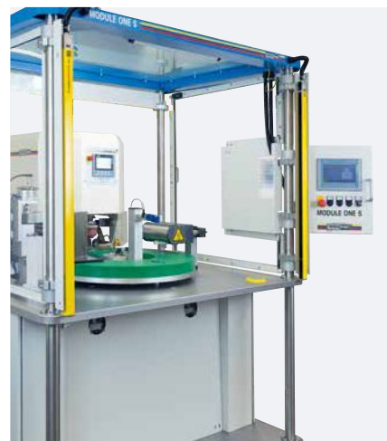
Naklápěcí řídicí panel s uživatelsky přívětivým ovládaním

Výroba a montáž jsou zredukovány díky standardizaci veškerých přídatných komponent. Pouze specifické zakládací přípravky budou vyrobeny na míru. Dle požadavků výroby lze vybrat mezi standardním a podtlakovým zakládacím přípravkem.