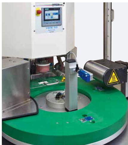
Multifunkční zakládací přípravek, tampónový tiskový stroj a komponenty

Poloautomatizovaný MODULE ONE S je používán pro jednoduché aplikace v tampónovém tisku. Díl určený k potisku se manuálně vloží i vyjme.