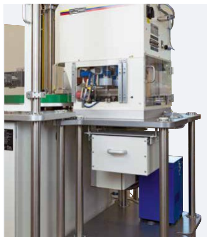
Umístění satelitu na zadní straně stroje se snadným přístupem k tiskovým jednotkám, výměně barvy.

Základem MODULE ONE S je kompaktní rám, otočný polohovací stůl a jeho tiskový satelit. Jako satelit lze použít tampónové tiskové stroje z následujících sérií: HERMETIC, SEALED INK CUP E a také V-DUO. Další pozice otočného stolu mohou být vybaveny různými komponentami.